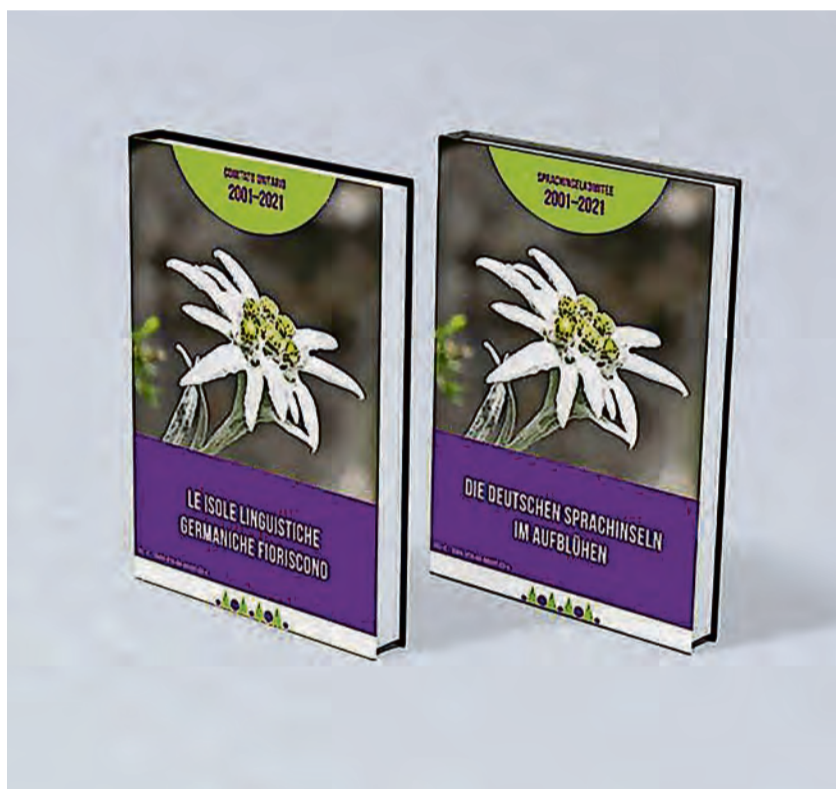
I dui cuertli, chël dant y chël do, dl liber gnü fora por i 20 agn de ativitè dl Comitè unitar dles comunitàs todëscas storiches tla Talia.

Les isoles todëscas dles Alpes sön teritore dla Talia é gonot tema